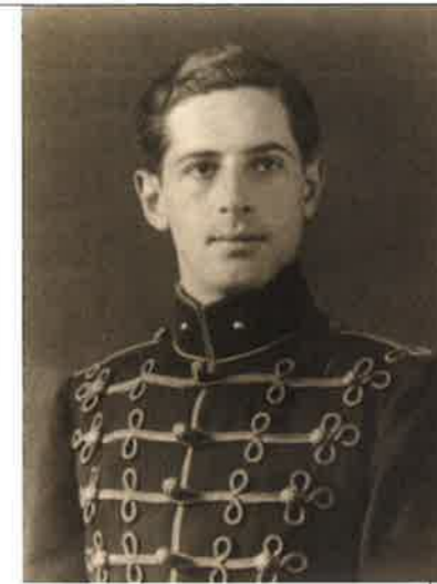
In zijn legeruniform als kornet van het Vierde Regiment der Huzaren, 1939.