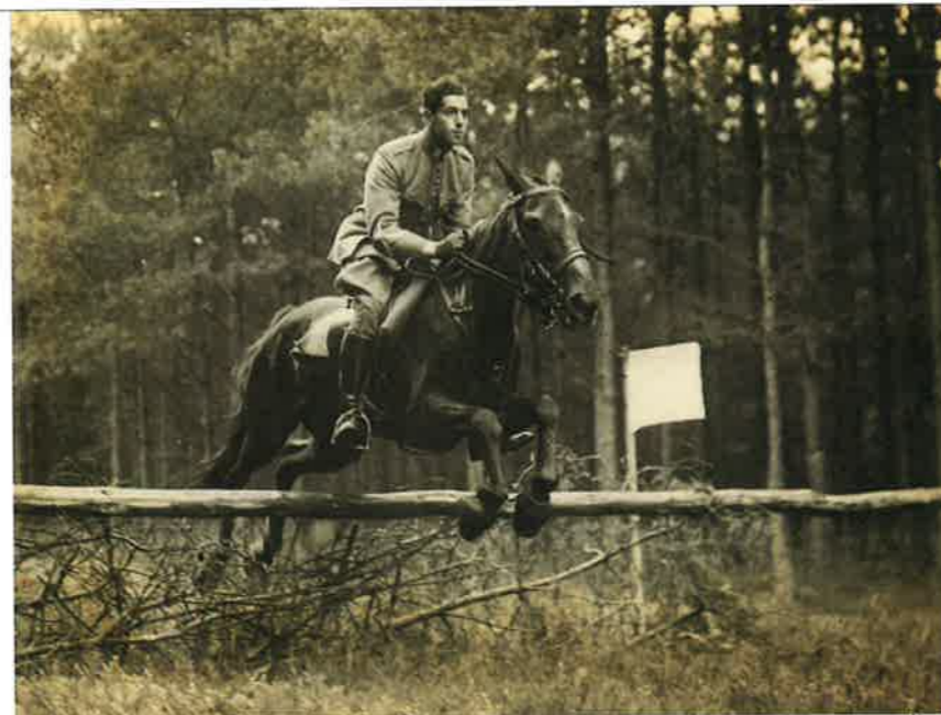
Cavaliëmanoeuvres in Amersfoort, juli 1937.